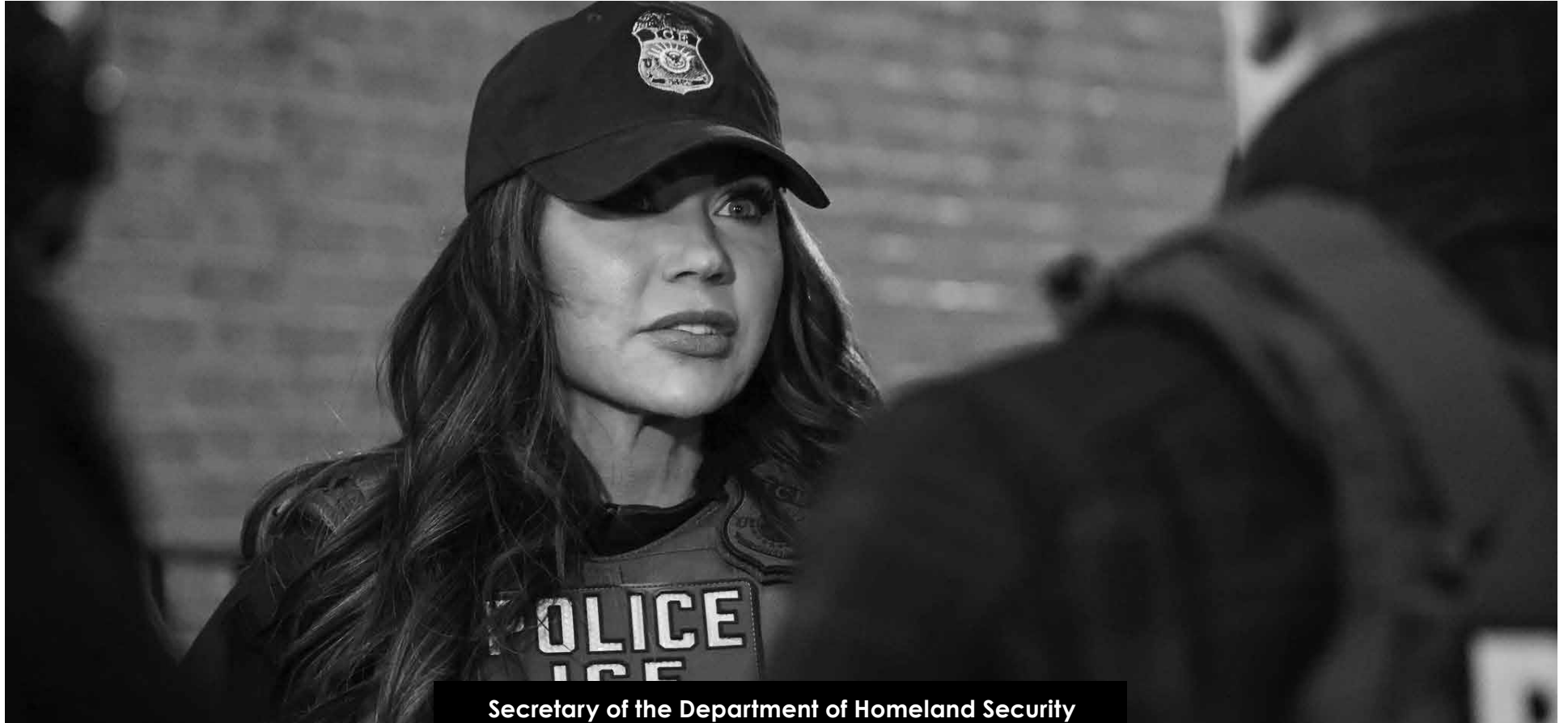
Secretary of the Department of Homeland Security Kristi Noem in an ICE raid in New York , NY

In the last week of February, the United States Citizenship and Immigration Services (USCIS) announced a proposed alien registration requirement. This requirement mandates many foreign nationals present in the United States to submit an online registration and undergo fingerprinting. Individuals over the age of 18 must carry proof of registration at all times.