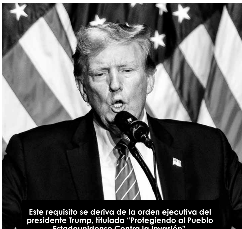
Este requisito se deriva de la orden ejecutiva del presidente Trump, titulada “Protegiendo al Pueblo Estadounidense Contra la Invasión”.

- Los padres y tutores legales de extranjeros menores de 14 años que no se hayan registrado y permanecen en los Estados Unidos durante 30 días o más deben presentar la solicitud antes de que expiren esos 30 días.